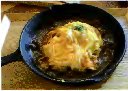
自家製 ハヤシソースオムライス 1,058円

濃厚なハヤシソースとオムライスの相性は抜群！卵がとろとろしていて幸せな気持ちになります。オムライスのソースは種類豊富なので何度も通って制覇したいです。