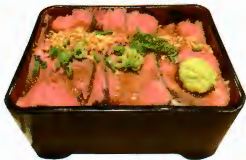
牛たたき重 ※味噌汁、小鉢付 1,150円 肉のうま味を凝縮した牛たたきをご飯が見えなくなるほど敷き詰めのお重! ポリューム満点です!