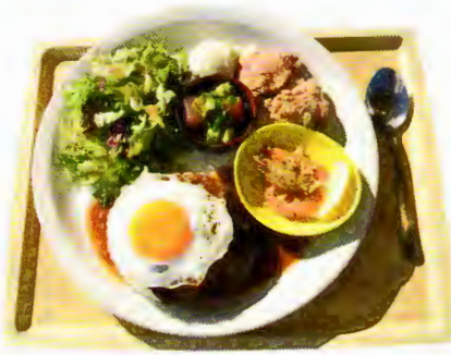
ハワイアン・コンボプレート 1,590円

欲張りな人はこれを食べれば間違いなし! ロコモコ、ガーリックシュリンプ、モチコチキン、アヒホキ、サラダが入っており、どれもハワイを感じさせるものばかりです。